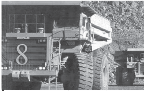
La actividad minera crece en todo el país y en Santa Cruz también.