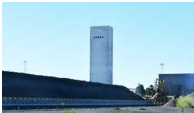
La MCC de Sierra Grande, uno de los actuales proyectos mineros

Asimismo esto demandará la incorporación de nuevas tecnologías en otras 2.000 que tienen una fuerte incidencia en la creación de nuevos empleos, radicadas en general, en zonas alejadas de los grandes centros industriales, en las que se desarrolla la mayor actividad minera.