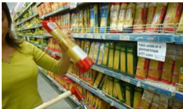
Ir al mercado, la medición palpable de la inflación.

Para los próximos días se espera conocer la Encuesta Permanente de Hogares, que mide, entre otros rubros, la desocupación trimestral en la comarca Viedma-Patagones.