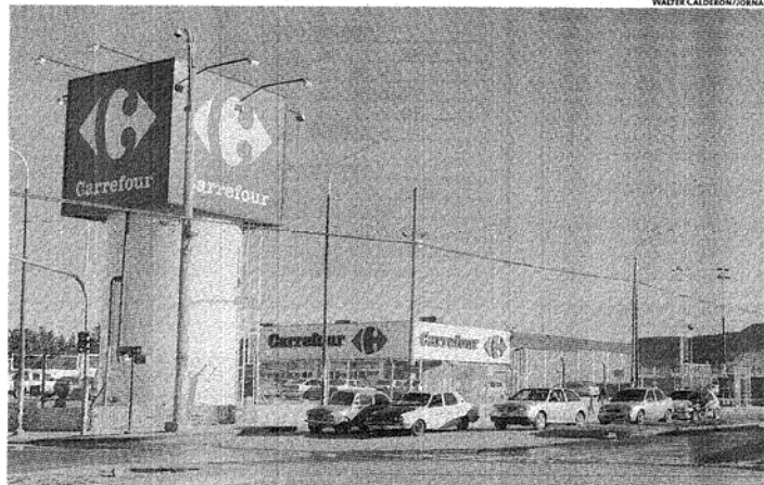
UN PROYECTO. ASEGURAN QUE LA INICIATIVA ESTÁ IMPULSADA POR DIVERSAS CÁMARAS EMPRESARIALES.

Esto trajo a colación, explicó, que "las cámaras de supermercados con asiento en esa ciudad hayan rubricado un acuerdo para que se establezca una ordenanza que utilice el ya mencionado 'patrón ocho' como medida que fija el tamaño de los supermercados".