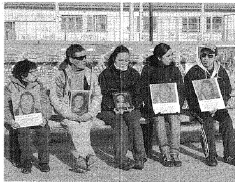
SIN COMPañIA. LOS FAMILIARES SE AUTOCONVOCARON A TRAVÉS DE FACEBOOK.

"Esta manifestación –agregó– era para reunir a la gente de los desaparecidos para aunar fuerzas y sobre todo, evitar que estas cosas sigan pasando. Pedimos que se trabaje y se investigue. La Justicia es muy lenta en relación a nuestro sentimiento. No queremos que las causas se archiven, que las cosas queden en la nada. Pido que los comodorenses se saquen la venda de los ojos, porque no hay tranquilidad y esto le puede pasar a cualquiera. Ni siquiera podremos mandar a nuestros hijos a un cine o a un baile".#