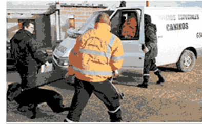
Agentes de Servicios Especiales Caninos trabaja ante las denuncias realizadas por los vecinos.

de control han sido detectadas, en distintos barrios de la ciudad, peleas clandestinas de canes, situación que también ha sido denunciada por vecinos. “Es importante que los vecinos nos señalen estos hechos y que podamos identificar a los propietarios para labrar las actas de infracción correspondientes. De todos modos, en caso de que esto no sea posible, se retiene el can en esta dependencia”, indicó finalmente.