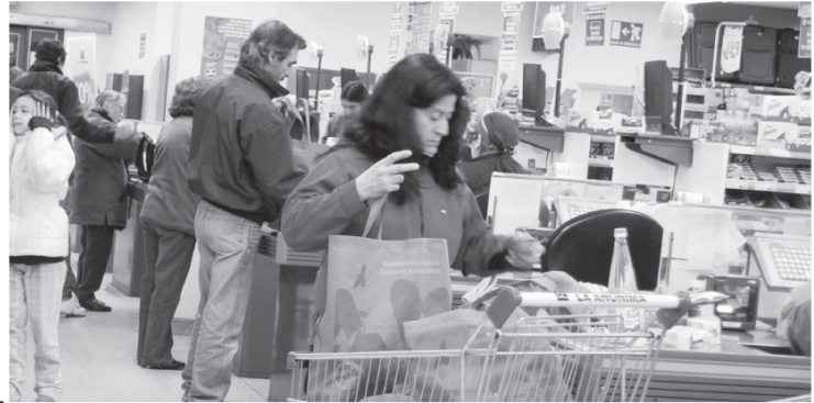
Los vecinos debieron adaptarse al uso de bolsas de tela.

En este sentido, comentaron que “necesitábamos las bolsas de polietileno para recolectar los residuos de nuestros hogares. Antes la única manera de conseguirlas era cuando íbamos a los supermercados y la utilizábamos para transportar las compras. Ahora no tenemos ni eso”. Por otra parte, resaltaron que “si