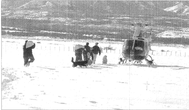
Acarreo de mercadería para repartir en los puestos de la zona afectada por la nevada.

Refirió también que sabe que hay situaciones sumamente complicadas en establecimientos de la zona. A su criterio, sería difícil sostener una estructura con alimentos y equipo para posibles contingencias climáticas, ya que "resulta difícil prever tormentas tan grandes. Por ahora la situación en el campo está controlada, siempre; cuando no vuelva a nevar; igual, las pérdidas se van a sentir más adelante".