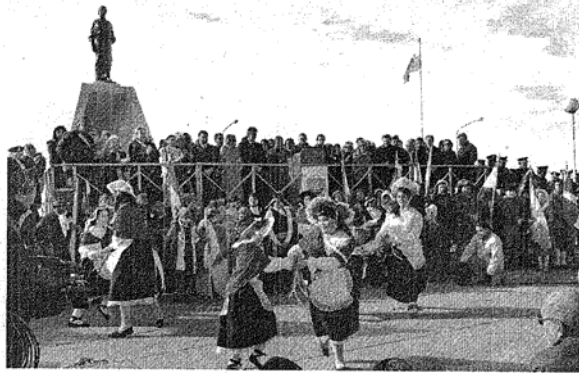
Frente al monumento a la Mujer Galesa, Puerto Madryn celebró ayer su nuevo aniversario.

nuestra obra sin depender de auxilios ajenos” expresó y volviendo a valorar la fuerza de los chubutenses dijo que “como en otros momentos difíciles no dejaron solo a este gobierno”.