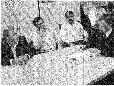
El intendente ayer durante la firma de la adjudicación de la obra presupuestada en poco más de 3,7 millones de pesos.

Se trata de una ampliación de 1.500 metros cuadrados en el edificio ubicado en Kilómetro 4. Comprende la construcción de un pabellón de estudio para el desarrollo de energía eólica y biodiesel, además de la planta alta del módulo de apoyatura. La obra será desarrollada por la empresa Gresuco.