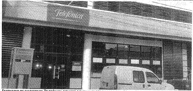
ESCENARIO DE EMOCIONES. TELEFÓNICA SIEMPRE OCUPA LUGARES DE PRIVILEGIO A LA HORA DE LOS RECLAMOS POR FALLAS.

La historia con Telefónica Argentina está trazada por los desencuentros y las promesas incumplidas durante estos años, situación que llevó al con-