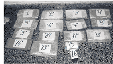
16 fueron los paquetes que estaban en un bolso.

Según datos recabados por La Prensa de Santa Cruz