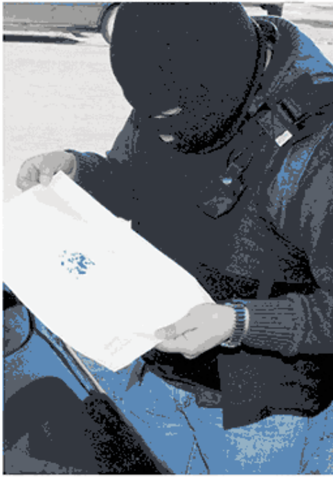
Un policía realiza test de reactivo.

De acuerdo a datos recabados por La Prensa de Santa Cruz, Reales se habría separado de su mujer hace al menos cuatro meses y cuya ex esposa realiza tareas en el área social de la municipalidad, conteniendo a jóvenes con problemas de adicción.