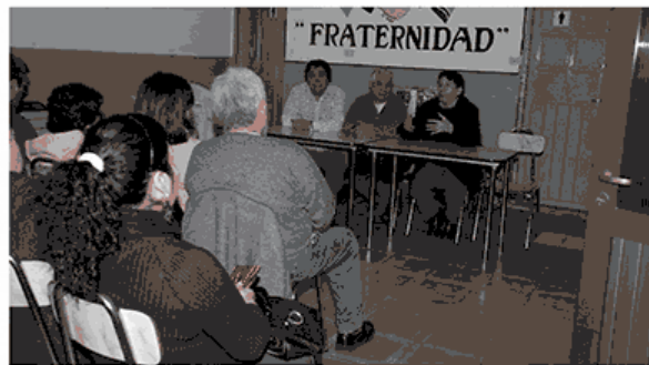
Cané recibió el jueves a los jubilados de APAP, durante su visita a la zona norte.

"Reivindicamos el pago del pasaje a los jubilados por ser un derecho adquirido y logro de luchas y conquistas gremiales. Exigimos la derogación del Decreto 1667 de fecha 27 de diciembre de 1996