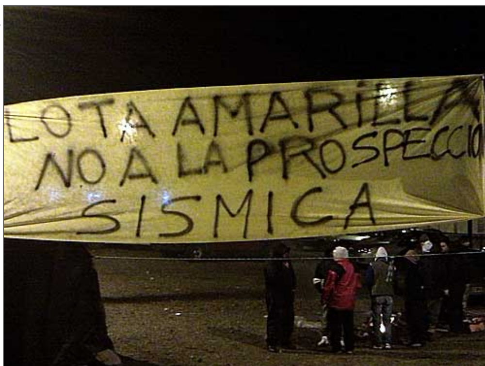
Los trabajadores de la pesca están en el puerto haciendo una retención de servicios.

Los trabajadores de la Flota Amarilla con el apoyo del SOMU, iniciaron una retención de servicios en el puerto de Caleta Paula. La actividad en el mismo sería normal y sólo le estarían impidiendo la salida a los barcos. Con una carpa instalada y alrededor de 120 trabajadores la protesta es pacífica, pese a que se encuentra una fuerte presencia policial en el sector.