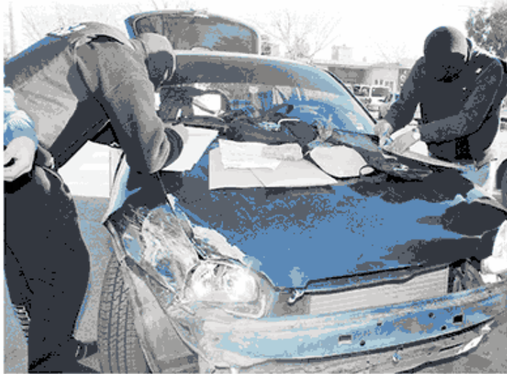
Efectivos de la División Delitos trabajan sobre el vehículo donde se encontro cocaína y dinero.

En tanto, el Chevrolet Corsa permaneció con custodia policial en las inmediaciones