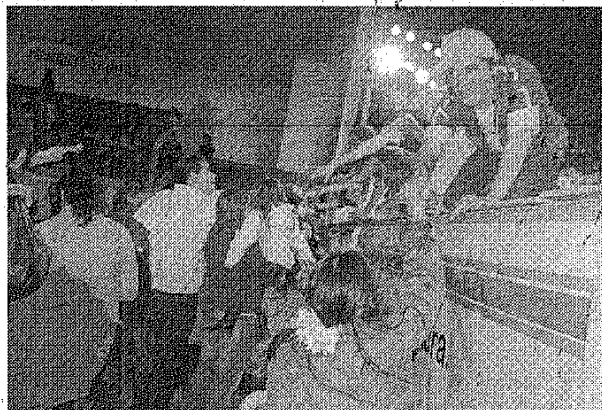
Los niños saludan al elenco de "Zoológico" tras la función en el Complejo Municipal.

En este sentido, desde la Secretaría de Cultura, Deportes y Turismo de Caleta Olivia, Jorge