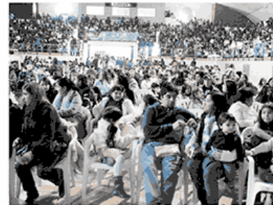
Miles de niños fueron agasajados ayer por el municipio con una obra de primer nivel.