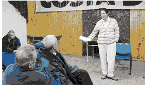
El diputado nacional por Santa Cruz le explicó a los ex trabajadores su proyecto de ley.

Finalmente Costa destacó la voluntad de su bloque y de todo el Acuerdo Cívico y Social para saldar esta deuda con los ex trabajadores de