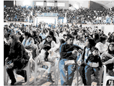
Miles de niños fueron agasajados ayer por el municipio con una obra de primer nivel.