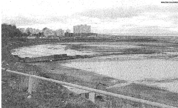
EL PROYECTO AFECTA UNA AMPLIA FRANJA SOBRE PLAYA SUR. SE RELLENARÁN CON TIERRA 54 MIL METROS CUADRADOS.

Se trata de un emprendimiento que demandará una inversión de más de 50 millones de dólares. Contará con un hipermercado, tiendas, patio de comidas, un lobby y multicine de ocho salas, oficinas de servicios, y un hotel casino de cuatro estrellas, entre otros servicios.