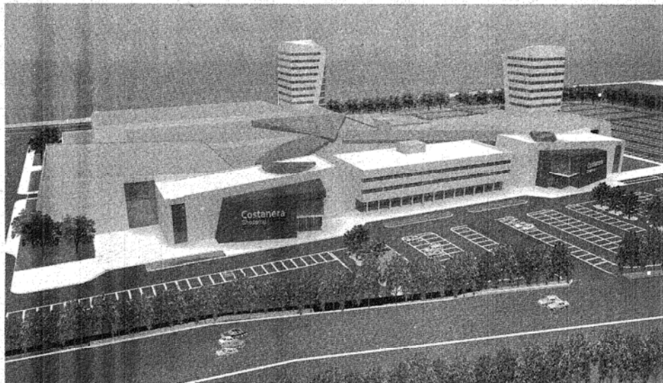
MAQUETA. EL PROYECTO LO LLEVA ADELANTE URBANIZADORA GEA, FIRMA INTEGRADA POR LAS EMPRESAS LOCALES, OIL M&S, RIGEL S.R.L Y EDISUD.

La construcción del hipermercado se inicia en octubre o noviembre.