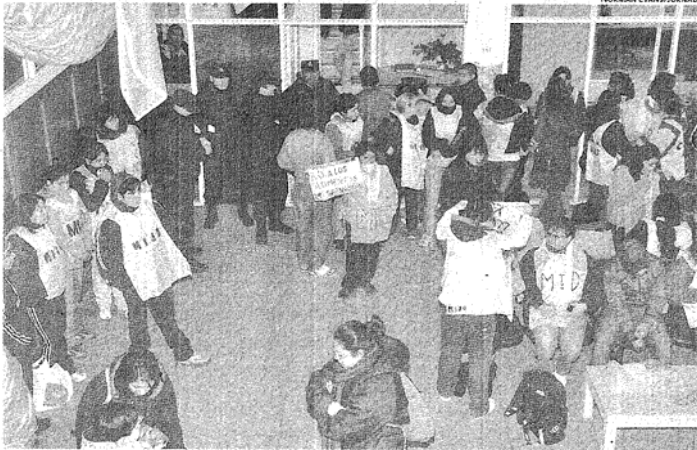
EL MOVIMIENTO INDEPENDIENTE DE JUBILADOS Y DESOCUPADOS (MIJD) RECHAZÓ EL AUMENTO.