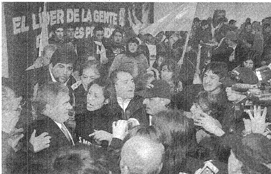
RODEADO. EL GOBERNADOR Y PRECANDIDATO PRESIDENCIAL, CON LA PRENSA Y MILITANTES. FUE AL FINALIZAR EL ACTO.

El mandatario dijo que se puede combatir la inflación “con un Estado que gaste menos, con un Ministerio