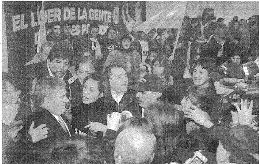
RODEADO. EL GOBERNADOR Y PRECANDIDATO PRESIDENCIAL, CON LA PRENSA Y MILITANTES. FUE AL FINALIZAR EL ACTO.

El mandatario dijo que se puede combatir la inflación “con un Estado que gaste menos, con un Ministerio