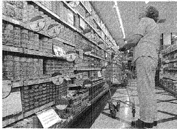
CALCULAN QUE LA INFLACIÓN SE COMERÁ LA MEJORA EN EL SALARIO MÍNIMO.