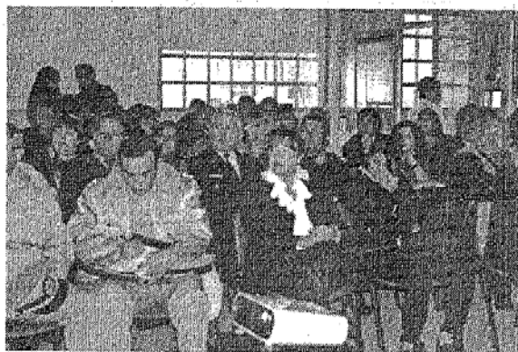
La presentación del informe de gestión se hizo ante autoridades y vecinalistas.

A través de un video se graficaron las acciones desarrolladas en los barrios Máximo Abásolo y San Cayetano, donde se trabajó con jóvenes en situación de conflicto.