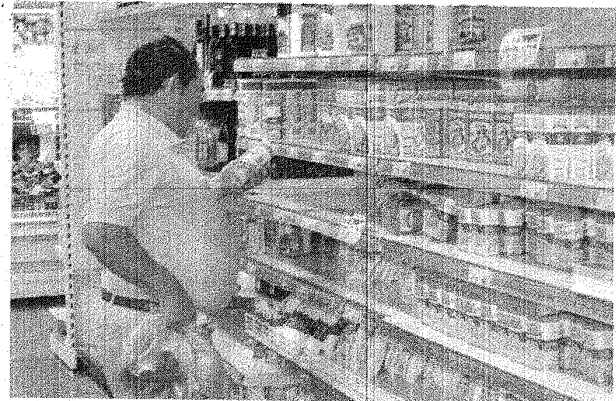
El consumo en alimentos registró un aumento del 4,3%, verificándose el mismo en productos de almacén, carnes y bebidas.

Los resultados obtenidos permiten identificar pautas de consumo que reflejan una mejor situación en la coyuntura de corto