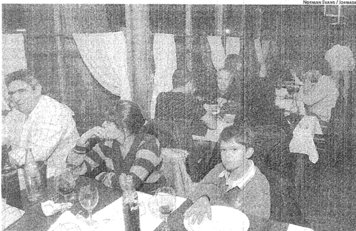
PARA ARRIBA. LOS AUMENTOS, EL ACCESO AL CRÉDITO Y EL CRECIMIENTO DEL EMPLEO INFLUYEN EN EL AUMENTO DEL CONSUMO.

Las familias chubutenses cerraron el primer cuatrimestre con un consumo mayor al primero del año 2009. Así como ocurrió con las inversiones, las exportaciones y el gasto público, el consumo también es un factor que ha traccionado el crecimiento en Chubut en lo que va de 2010, según un