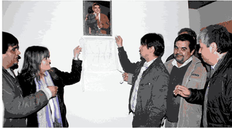
La reapertura en Caleta se realiza en el marco del 25° aniversario de la Seccional Santa Cruz.

Es en esta oportunidad, en la que se cumplen 25 años