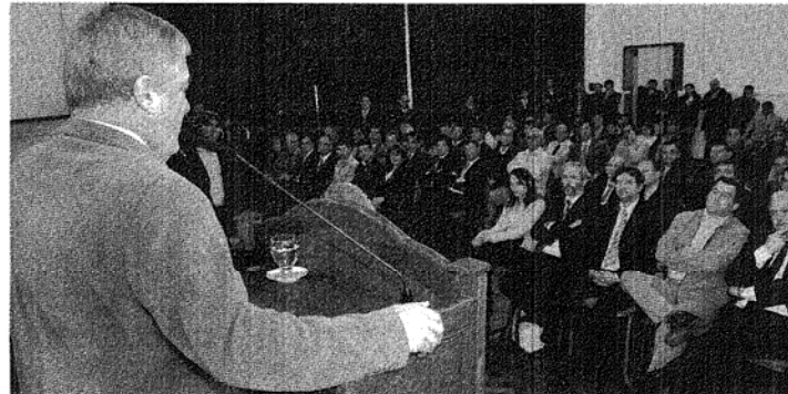
DESDE ARRIBA, DAS NEVES APROVECHÓ EL DISCURSO Y DISPARÓ CONTRA EL SUBSECRETARIO DE PESCA NACIONAL.

"En política -agregó- no te alejas tanto ni te acercas tanto, lo único que tenés que mantener es siempre la misma conducta. Si a mí me preguntan sobre Macri, yo soy respetuoso de