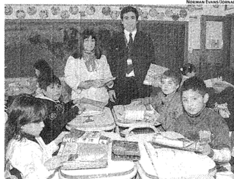
ESTA ES UNA NUEVA EDICIÓN DE LA REVISTA DE EDUCACIÓN AMBIENTAL.

Así, los más chicos se inmiscuyen en el tratamiento de los residuos urbanos, su reciclaje y reutilización de manera didáctica, inclusive, con muchas ideas para trabajar no sólo en la escuela, sino también en casa y en familia.