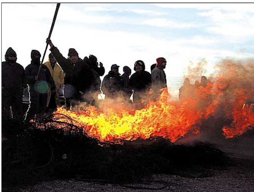
Hay fuertes internas dentro de la manifestación de quienes aspiran a ser mineros.

La determinación en YCRT de dar un margen de 15 años de residencia para los aspirantes a entrar en la mina, fue determinante para que se generaran asperezas entre los que están haciendo menos de dos meses y los que cumplen con el requisito. Al parecer ya hay quienes se están abriendo de la posición más dura.