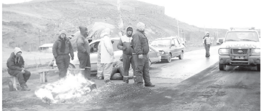
Manifestantes durante el corte de ruta.