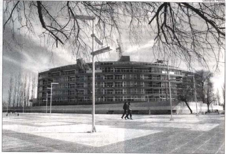
El proyecto anunciado por el intendente y el gobernador se suma a varias obras que ya están en su etapa constructiva final.

La funcionaria dijo que entre las urgencias para terminar de lanzar la isla está la iluminación, ya que por el momento los faroles