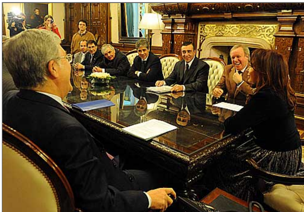
Las autoridades nacionales y provinciales ayer en la Casa Rosada.

El consorcio se preadjudicó las obras para la construcción de las represas hidroeléctricas Cónдор Cliff-La Barrancosa. Dentro de dos meses serán adjudicadas definitivamente. Los embalses generarán 1.740 MW.