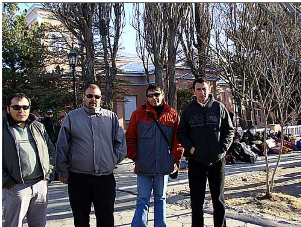
Los delegados de la Flota Amarilla ayer en Casa de Gobierno acompañando a los trabajadores de la ex Barillari.

La escasez del recurso ictícola y en especial de la merluza, ha hecho que los trabajadores de la pesca en Caleta Olivia hayan recorrido más de 700 km para traer su preocupación ante las autoridades del Gobierno provincial por la caída de la actividad.