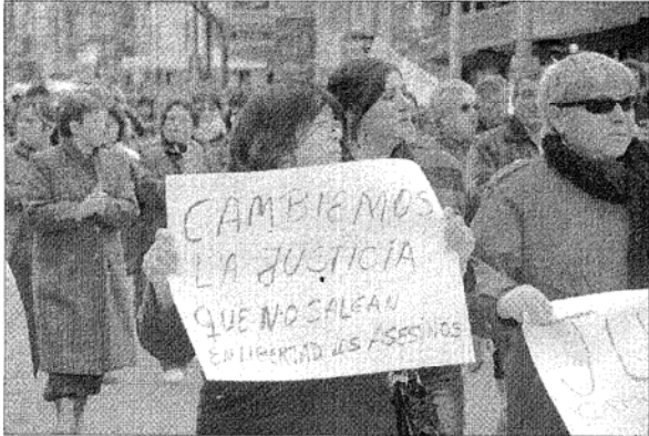
Movilizados. La idea de que cualquiera puede ser víctima de esa violencia arbitraria, nuevamente moviliza familiares y amigos de las víctimas.

hacer cálculos de probabilidad, serán víctimas. Y éste es el principal logro del discurso de la inseguridad; nos convenció de que estamos en riesgo sin