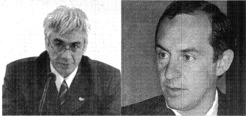
ENFRENTADOS, CASTRO VERSUS CASTRO, AMBOS FUNCIONARIOS SE CRUZARON AYER POR UNA ORDEN JUDICIAL QUE BENEFICÓ A UN INTERNO DE LA ALCALDÍA.

La decisión judicial que le permitió a un reo ser trasladado más de 50 kilómetros para comunicarse con su familia generó un fuerte cruce entre el abogado defensor y el ministro de Gobierno. El funcionario dijo que es "un disparate".