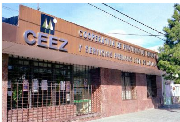
Cooperativa de electricidad de Zapala.