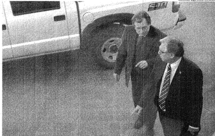
A PASO FIRME. LOS MINISTROS DEL SUPERIOR TRIBUNAL DE JUSTICIA CAMINAN HACIA EL ENCUENTRO CON LOS PERIODISTAS.

Otra, ejemplificó, tiene que ver con "políticas en prevención". En este marco comentó que "existe una segunda ley, la XIX, por la que se crea una Comisión Preventiva (sic) en materia de seguridad, bajo funcionamiento en