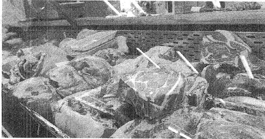
EN ALGUNOS PRODUCTOS, COMO LOS CORTES POPULARES DE CARNE, LA DIFERENCIA SUBE HASTA EL 25 POR CIENTO.

Aunque la implementación de este tipo de acciones logró sostener la demanda y motorizó gran parte del con-