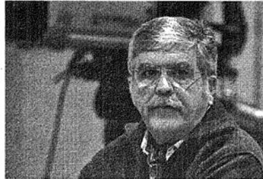
■ Desde el Gobierno, buscan llevar tranquilidad a los usuarios.

También remarcó que en el proceso de migración del millón de clientes de la empresa que estaba operando de manera ilegal "no ganan las telefónicas, que ni siquiera han apoyado la medida del gobierno", ya que hay