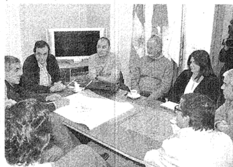
PROFESIONALES. SIGUE EL TRABAJO PARA TERMINAR CON LA HISTÓRICA EROSIÓN.

Cabe señalar que las costas de Playa Unión se han visto sumidas en un proceso de erosión marina que creció con los años. Tanto en Playa Unión con la construcción de los espigones, como en Playa Magagna con la construcción de las defensas, hubo buenos resultados pero no obstante el proce-