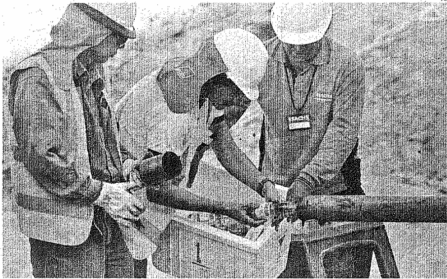
■ Los rescatistas introducen botellas de agua en los "tubos" que bajan hasta los mineros.

SE LO DIJO UNO DE LOS MINEROS AL PRESIDENTE PIÑERA