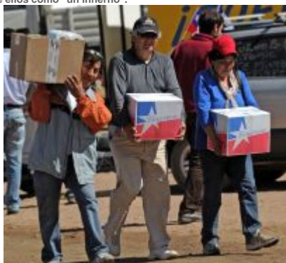
Los familiares de los 33 mineros que han estado viviendo en condiciones inimaginables bajo tierra durante 20 días en la mina de oro y cobre de San Esteban en Copiapó, 800 km. al norte de Santiago, cargan cajas con alimentos y otros suministros por el Gobierno.

El gobierno chileno preparaba una estrategia para que los 33 mineros atrapados en una mina aguanten física y psicológicamente los cuatro meses que se calcula estarán bajo tierra mientras son rescatados, en una situación definida por uno de ellos como "un infierno".