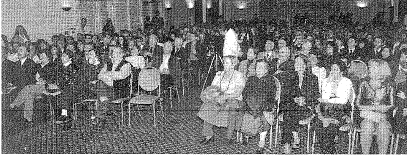
Gran cantidad de público asistió a la conferencia del ex presidente uruguayo.

Confío además Das Neves que junto a Sanguinetti "estuvimos hablando del rol de los ex presidentes" y volvió a remarcar que "yo sueño con una Argentina donde los ex presidentes sean hombres de consulta. Tener a los Sanguinetti, a los Tabaré (Vázquez), en poco tiempo a Lula, cuando deje la función, tener a los Ricardo Lagos, a los (Michelle) Bachelet, no hay que ir al mundo, hay que ir acá nomás alrededor para tener estas experiencias", dijo para resaltar que "me voy muy gratificado con una charla que tiene que ver con la consolidación, en el presente pero a futuro de las posibilidades electorales que tengamos con el hermano país de Uruguay".