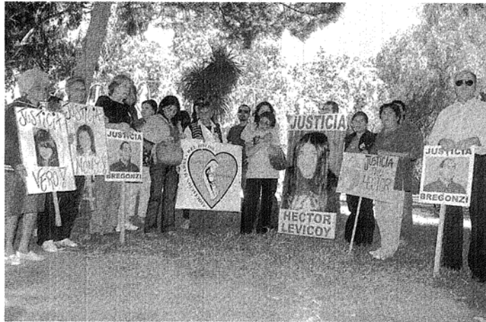
RECLAMO ETERNO. LOS FAMILIARES DE VÍCTIMAS PIDEN QUE NO SE BENEFICIE A LOS IMPUTADOS CON PRISIÓN DOMICILIARIA.

Es la cantidad de detenidos bajo esa modalidad. La Policía reconoce que es su deber controlar, pero también debe atender la seguridad de la ciudad. Víctimas de la Delincuencia pide que los jueces no otorguen esos beneficios.