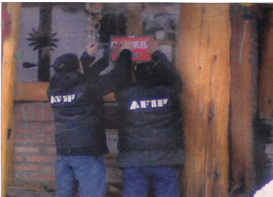
Las clausuras de la AFIP comprenden todos los rubros. Los profesionales también son investigados.