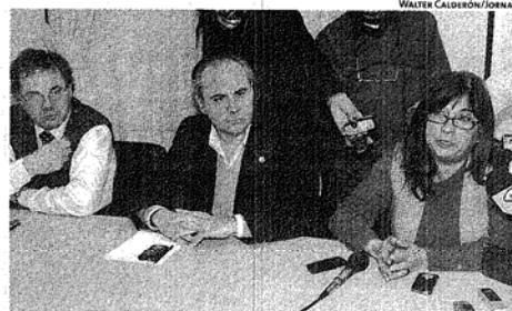
CONTRA LAS OCUPACIONES. EL TEMA FUE MOTIVO DE UNA CONFERENCIA.

"En el caso de la maquinaria la vamos a secuestrar, para que la empresa también asuma la responsabilidad