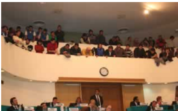
Ante bandejas colmadas, sesionó la Legislatura y aprobó la extensión de las concesiones petroleras.