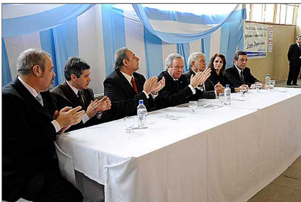
El Gobernador visita la zona norte de la provincia.

Así lo aseguró en rueda de Prensa el Gobernador de Santa Cruz luego de concluir el acto institucional en Perito Moreno. Asimismo hizo hincapié en la importancia de "afianzar el crecimiento de la comarca", al tiempo que instó a los peritenses a "dejar de lado las rispideces para trabajar en conjunto por el desarrollo de la comunidad".