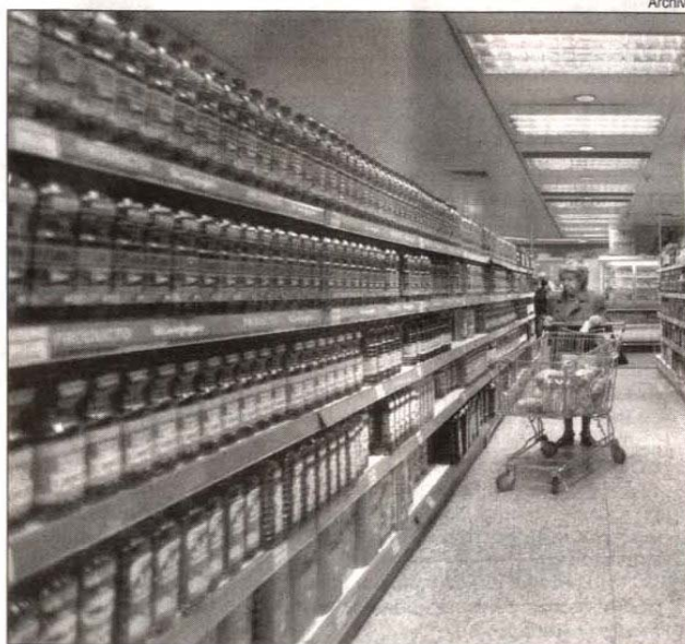
La inflación golpea con más fuerza en los alimentos de primera necesidad.

“Es una disyuntiva para Argentina tener este nivel de crecimiento pero con alta inflación. Se