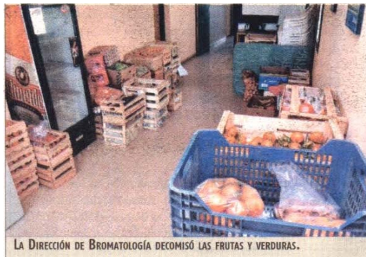
LA DIRECCIÓN DE BROMATOLOGÍA DECOMISÓ LAS FRUTAS Y VERDURAS.

Por último, subrayó: "Hay varias ferias que se han habilitado en esta gestión del intendente Farizano. Algunos de estos puestos están en Villa Ceferino y Confluencia, los miércoles en Islas Malvinas, los jueves en Alto Godoy, los sábados en la feria de calle Independencia y los domingos en Unión de Mayo. Esos son lugares donde se puede vender este tipo de productos. Están correctamente controlados, no solamente por el área de Comercio, sino también por el área de Bromatología".