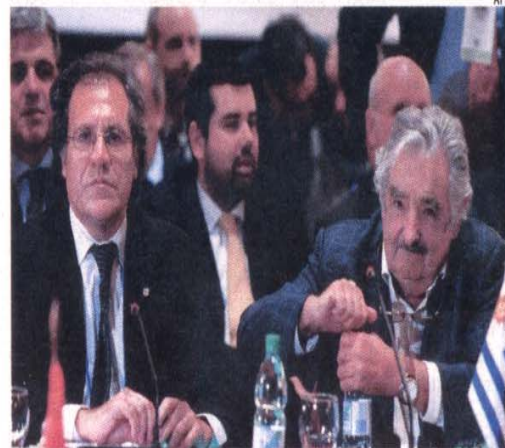
EL CANCELLER LUIS ALMAGRO JUNTO AL PRESIDENTE URUGUAYO, JOSÉ MUJICA.

En ese sentido, señaló el tema de las negociaciones con la Unión Europea (UE), con Estados Unidos, China y otros mercados y potencias mundiales con los cuales el bloque