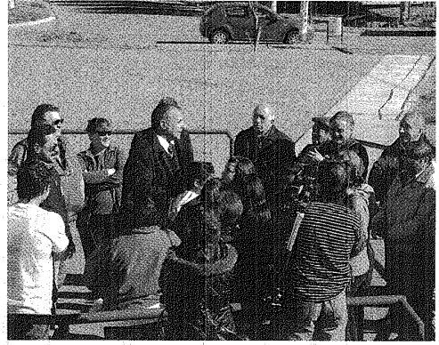
EN LA PLAZA DEL BARRIO PRÓSPERO PALAZZO SE INVIRTIERON 160 MIL PESOS.

Valoró el trabajo organizado de la población de la zona norte de Comodoro y remarcó que la obra se hizo posible "gracias a la voluntad y el trabajo que han venido llevando