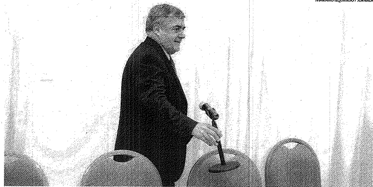
MARIANO IZQUIERDO / JORNADA

Para el funcionario, el debate por la Ley "no necesitaba de este marco, que no era el adecuado para sacarla", en referencia a la vuelta a Comisión de la norma. El viceministro remarcó "el esfuerzo" realizado para su elaboración e insistió en "la participación" generada en torno al mismo. También advirtió que las modificaciones introducidas "no hacían al espíritu de