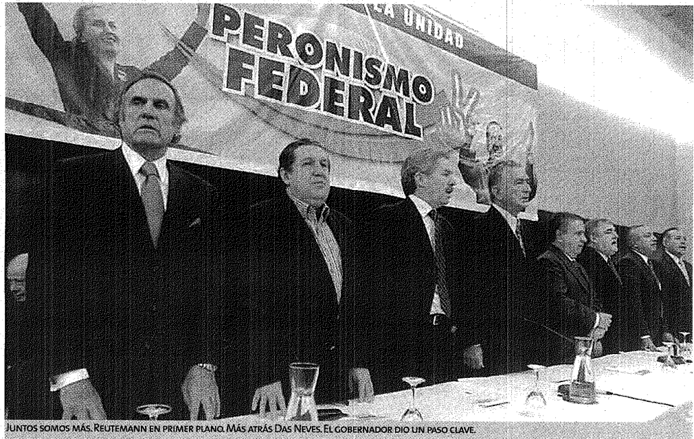
JUNTOS SOMOS MÁS. REUTEMANN EN PRIMER PLANO. MÁS ATRÁS DAS NEVES. EL GOBERNADOR DIO UN PASO CLAVE.

El encuentro del viernes fue clave: no habrá jefes y será candidato a presidente quien en su momento esté mejor posicionado dentro del Peronismo Federal. Y así enfrentar a los Kirchner.