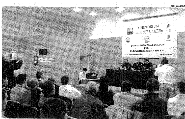
A SALA LLENA. FUERON DOS JORNADAS EN LAS QUE LOS ABOGADOS MERCANTILES HABLARON DE LEYES LABORALES.

El foro comenzó el viernes. En aquella oportunidad los abogados sindicales respondieron preguntas de los distintos delegados gremiales y se explicó el alcance de las leyes laborales nacionales vigentes. Después de las exposiciones se elaboraron las conclusiones del encuentro para ser entregadas a la Federación de Empleados de Comercio. #