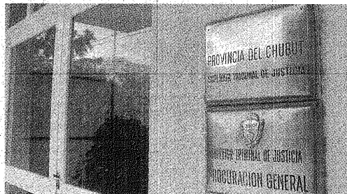
EL ESCENARIO. DEL SUPERIOR TRIBUNAL SALDRÁ LA DECISIÓN SOBRE EL COMICIO.

Los postulantes se enfrentarán, hasta ahora, con los propuestos por el Nuevo Espacio en la interna del PJ que se hará el 28 de noviembre próximo. #