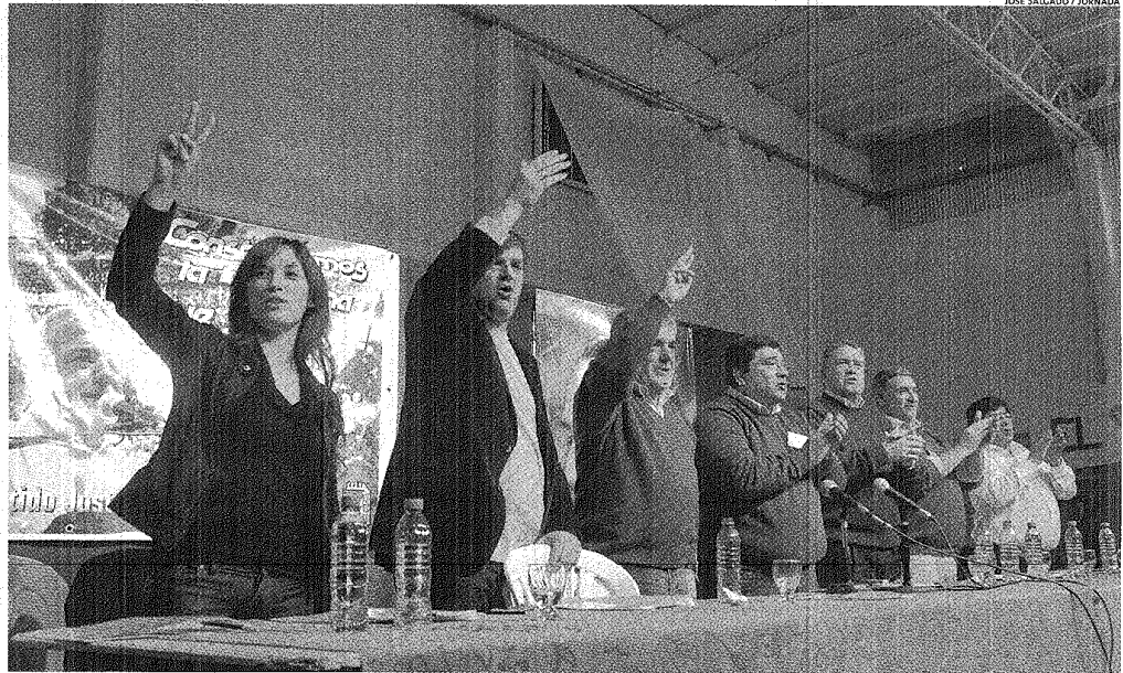
CONDUCCIÓN. UNA POSTAL DEL ÚLTIMO CONGRESO PERONISTA, EN SU PUNTO CULMINANTE Y TRAS APROBAR EL DISTRITO ÚNICO QUE YA QUEDÓ FIRME.