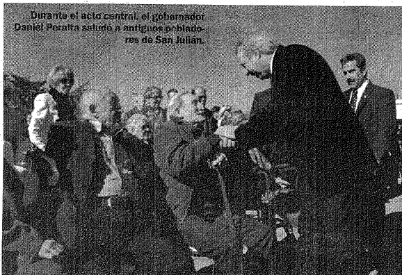
Durante el acto central, el gobernador Daniel Peralta saludó a antiguos pobladores de San Julián.

El gobernador Daniel Peralta estuvo acompañado por miembros de su gabinete y por su esposa, Blanca Blanco, actual diputada nacional.