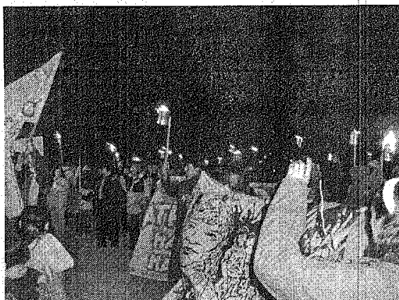
En Gan Gan tuvieron la primera marcha anti-minera.

yacimientos de Calcatreu (en Río Negro) y Navidad.