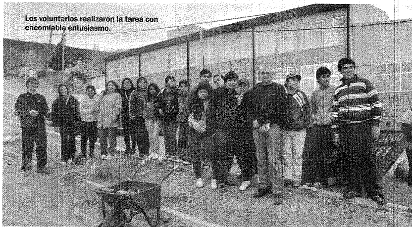
Los voluntarios realizaron la tarea con encomiable entusiasmo.

En un trabajo mancomunado con diferentes organizaciones de la sociedad, la Municipalidad de Comodoro Rivadavia llevó adelante en la mañana del sábado la segunda parte de la campaña de forestación del bulevar de calle Las Violetas al 1.100, donde participaron niños y adolescentes de diferentes entidades educativas de la ciudad.