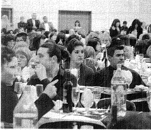
EL SINDICATO DE COMERCIO AGASAJÓ A LOS TRABAJADORES EN SU DÍA.

C on una gran concurrencia, ya que colmaron las instalaciones del gimnasio de la Escuela 751, los empleados de Comercio del Valle festejaron su Día Nacional en Trelew. Todas las tarjetas de la cena habían