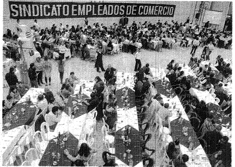
A LAS 22 DEL SÁBADO 25 ÚLTIMO, SE COMENZÓ A LLENAR LAS MESAS Y SE PRESAGIABA UN GRAN FESTEJO.

sido vendidas con anterioridad, y esto presagiaba el éxito de la jornada. Fue así, que a las 22 del sábado, las mesas se fueron llenando de trabajadores que querían festejar su Día junto a sus compañeros y dirigentes. #