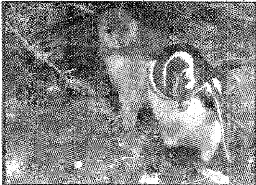
Patagonia: Walsby Abril - APD - Asociación Patagónica de Ornitología