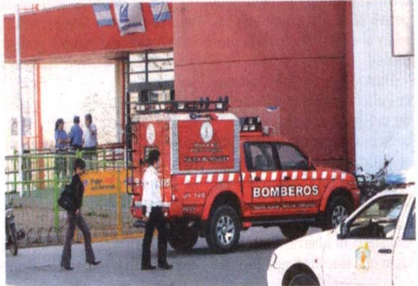
PERSONAL DE EXPLOSIVOS TRABAJÓ EN EL LUGAR.

Ocurrió ayer poco antes de las 16 cuando un portafolio fue detectado abandonado cerca de las salidas de los cines del Alto de la ciudad. De inmediato los responsables del complejo dieron aviso a los bomberos, que en cuestión de minutos cercaron el lugar y desalojaron el sector a modo de precaución.