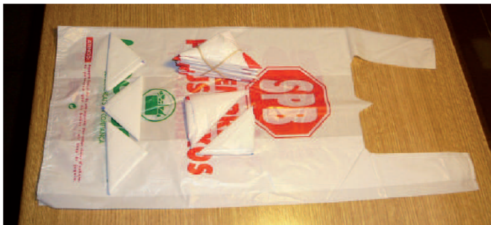
El 14 de diciembre se prohibirán las bolsas biodegradables.

Samuel Mascassini tuvo que ajustar su empresa, haciendo reducción de personal y de gastos. Insiste en que 6 meses no es tiempo para prohibir las bolsas y no ve cambios en la limpieza de la ciudad.