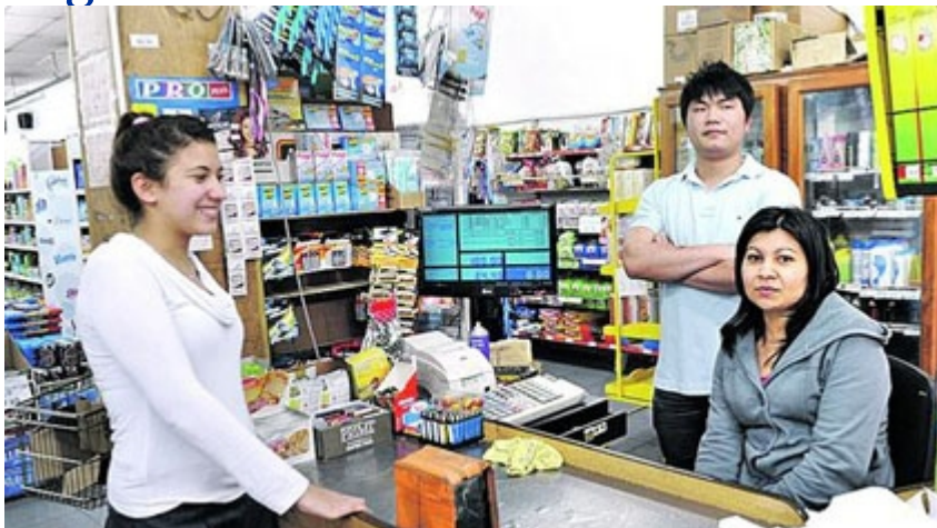
Casi 7 mil super chinos hay en Argentina.

Un supermercado chino se inaugura cada dos días en Argentina, donde la población de ese país asiático alcanza a 120.000 personas, informó este lunes a la AFP la Cámara de Autoservicios y Supermercados Propiedad de Residentes Chinos (Casrech).