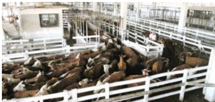
Mercado de Haciendas de Liniers

El precio de la carne en los mostradores aumentó hasta 75 por ciento en el año mientras que el consumo cayó 18 por ciento y en los últimos tres años el stock ganadero disminuyó en 9.400.000 cabezas.