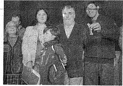
Das Neves comparte la felicidad de uno de los adjudicatarios de vivienda.

Haciendo hincapié en el "Estado presente" construido desde el